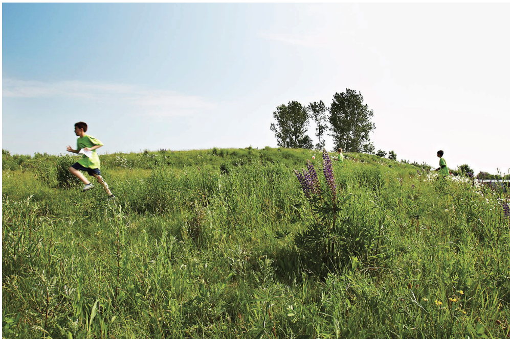
Der blev både løbet almindeligt motionsløb og orienteringsløb i området omkring Farum Park. Her er det orienteringsløb.

Farum Svømmeklub, Farum Bokseklub, Farum Squash Klub, Hareskov Frisbee Klub, Farum-Holte Volley, Judo klubben Kaisha og Farum Orienterings Klub.